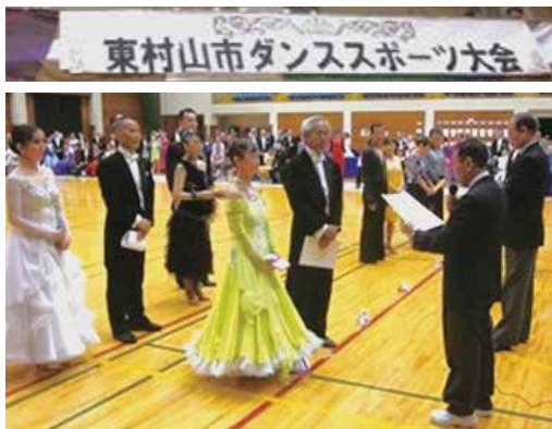
市長杯を争う春秋のダンススポーツ大会

※ 前号ご担当の東村山市さんの原稿掲載 / 今号ご担当予定の昭島市さんについては順延とさせていただきます。