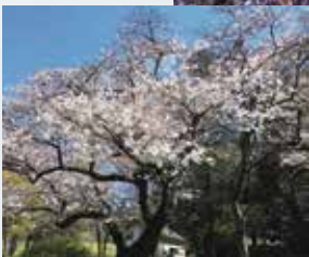
山手線内最高峰の戸山公園箱根山の桜