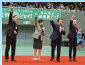
小池百合子都知事の祝辞と開会のエール