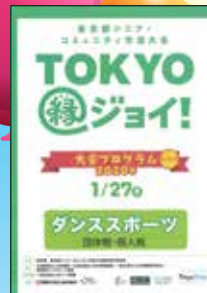
TOKYO 縁ジョイ! 大会総合プログラムとダンススポーツ版プログラム(右)