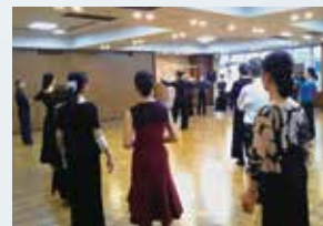
実践形式で真剣そのものの踊り込みが評判

東京DSC主催ではありませんが、広くダンススポーツのレベルアップに貢献する目的のため、参加者は会員に限らず、他組織から実践形式で真剣そのものの踊り込みが評判