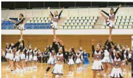
チア・リーディングとシニアスポーツ振興事業

ダンススポーツ連盟としてもこのパワーを少しでも活かそうと、今年度はシニアスポーツ振興事業を中心に展開しながら、小学生のチア・リーディングや車椅子ダンスとも連携して区民体育祭を3月に開催する計画を立てて準備してきた。