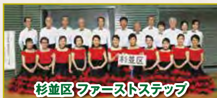
杉並区 ファーストステップ

競技選手を引退する年代になっても、フォーメーションは仲間との「練習とアフター」を楽しむ究極の生涯スポーツです。今年にはダンス最初の一步「マイムマイム」とサンバのパウンスアクションを楽しみました。シニア新入生も参加しました。