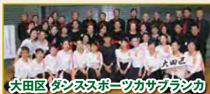
大田区 ダンススポーツカサブランカ

6年連続出場の杉並区「ファーストステップ」です。スタンダード種目のみの(W・T・Q)構成は初めてで、線と円を全員で意識して練習しました。会員の一体感が生まれ、いまはやり終えた達成感で満足しております。