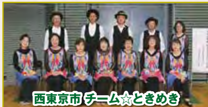
西東京市 チーム☆ときめき

北区のフォーメーションは技術認定のルーティンをベースとして、始めて1年の初心者と指導員のチームです。フォーメーションは仲間作り、そして地域の発表に使えます。どうぞこれからも温かい応援をお願いします。