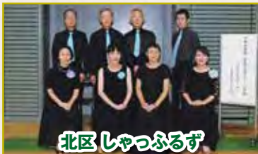
北区 しゃっふるず

北区のフォーメーションは技術認定のルーティンをベースとして、始めて1年の初心者と指導員のチームです。フォーメーションは仲間作り、そして地域の発表に使えます。どうぞこれからも温かい応援をお願いします。