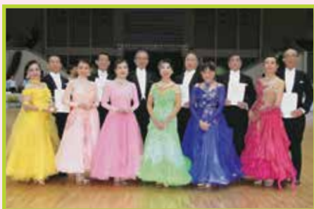
C級スタンダード 決勝入賞者