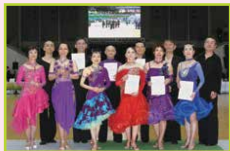
C級ラテン 決勝入賞者