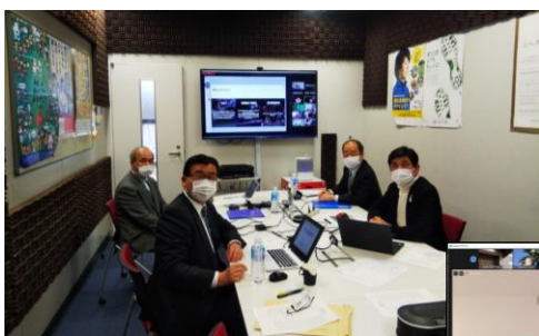
コロナ禍を考慮し、JDSF事務所には 理事ら4人のみが出席

2021年1月24日(日)、11時より臨時社員総会、13時より全国加盟団体代表者会議をオンラインにて実施。 全国代表者会議において、現状把握とともにコロナ時代を乗り切る対応方針などについて話し合われました。